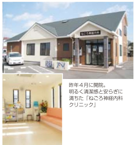
昨年4月に開院。明るく清潔感と安らぎに満ちた「ねごろ神経内科クリニック」

「もしも病気が見つかったら……と結果を恐れて健診を受けないままている人も少なくありません。脳は、肺や心臓とは違って、とりかえることのできない臓器です。定期的な健診を受けていけば、異常が見つかっても最小限に食い止めることができます。逆に自覚症状が出てから医療機関にかかるのは、病気に悩まされるリスクが非常に高くなります。基本は内科医ですから、風邪や熱、高血圧、糖尿病、高脂血症など、一般的な内科診療も行います。また、こうした生活習慣病の治療は、脳梗塞・認知症の予防にも必要です。普段から健康上のどんなことでも気軽に