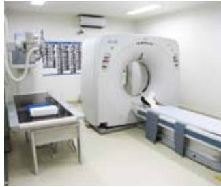
最新の医療検査機器を導入

「当クリニックでは、必要に応じて高速マルチスライスヘリカルCTや脳波、神経伝導検査、超音波（エコー）、レントゲンなどの検査を行っています。特に、頸動脈エコーは全身の動脈硬化の進行状態を把握できる検査法です。これらの検査によって自覚症状のない初期の脳こうそくや動脈硬化の進行状態を知ることができます。手術や入院治療が必要な場合は総合病院の神経内科、脳神経外科や整形外科