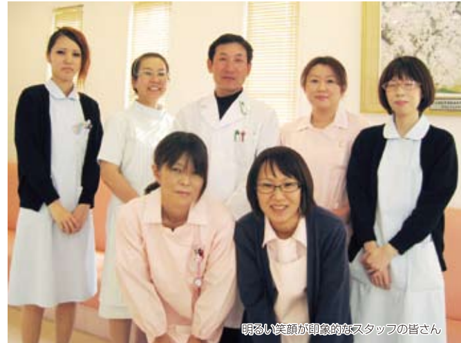
明るい笑顔が印象的なスタッフの皆さん

といった神経難病まで、年齢層も幅広いのが特徴です。症状としては、頭痛や物忘れ、ふるえ、めまい、手足のしびれ、物が二重に見える、うまく力が入らない、歩きにくい、ふらつく、つっぱる、ひきつけ、むせ、しゃべりにくい、意識障害など、たくさんあります。よく間違えられるのが、精神科、神経科、心療内科などです。神経内科は、これらの診療科とは異なり、心の病は専門としていません。脳や脊髄、神経、筋肉に原因があり、体が不自由になる病気を扱います。早期発見により適切なアドバイスを行えたり、見逃されていた疾患を見つけたり、過去の臨床経験から神経内科医としての使命を改めて強く感じました」